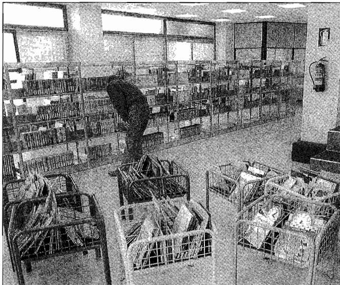
Zerbitzu preziatuenak liburutegia eta ia 5.000 dokumentu biltzen dituen fonoteka dira.

Kultur etxearen erakargarri nagusiak haur eta helduentzako liburutegi handia eta 5.000 dokumentu biltzen dituen fonoteka dira. Ez dira horietatik, baina, erabiltzaileek bertan erabili ahal izango dituzten zerbitzu bakarrak. Bestelakorik ere izango da: hemeroteka, bideoteka eta internet, besteak beste.