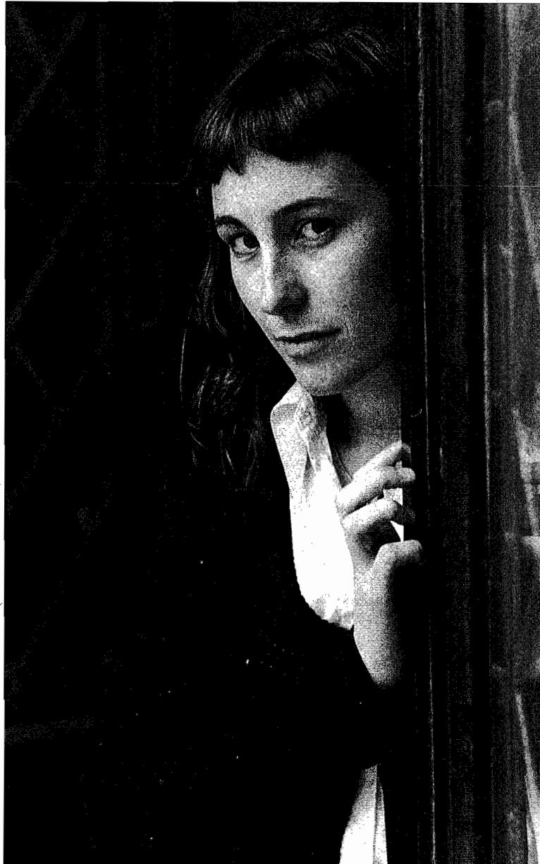
Maidier Alustizaren ustez, oso larria litzateke Bellas Artes eraikina deskatalogatzea bertan hotela eraikitzeko.

Salaketa hauek muntaia hutsa dira, eta ondo prestatutako estrategia baten