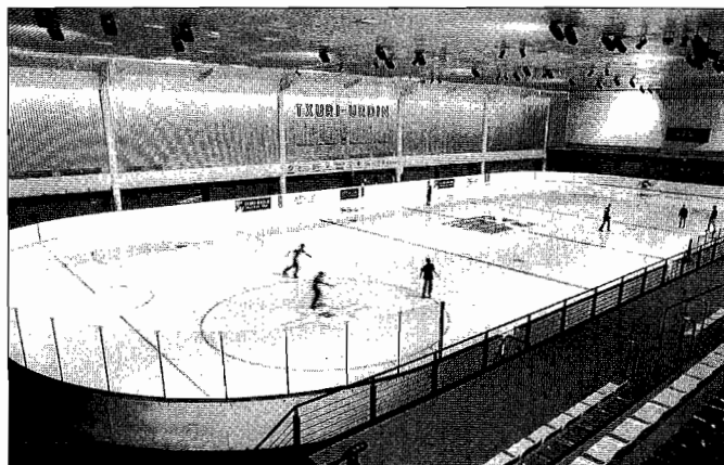
Otsailetik, 30.000 lagun izan dira Izotz Jauregian.

Izotz Jauregian txikienek ere beren lekua dute. Bertan jolaserako tokia dago. Hori dela eta, eguraldi txarra egon denean, hiriko udaleku ire-