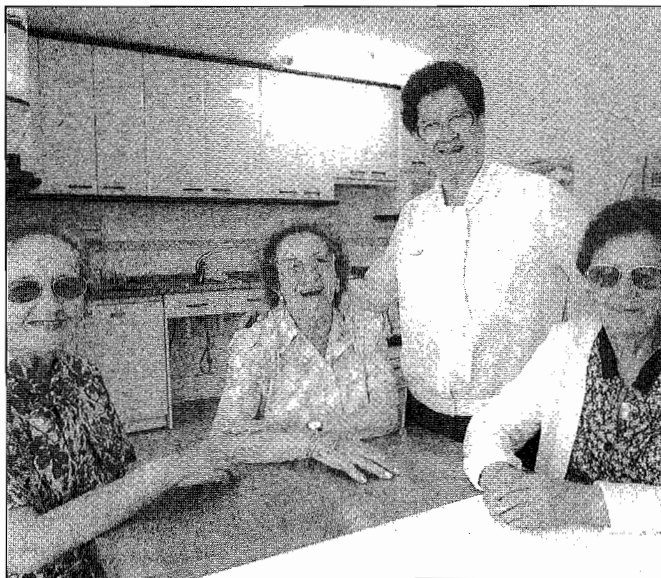
Txara 1-eko Bizikidetz Unitate Berezietan hainbat lagun bizi dira.

Etxebizitzok egitura txikia dute, pisu arrunt baten logikarekin aurrera eramaten dena. Zerikusi gutxi dute zahar etxeekin edo zentro bereziekin. Egitura txiki horrek erabilitzaileen beharrak betetzea errazten du, izan ere, pertso-