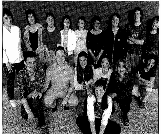
Plataformakoek bazkideak lortu nahi dituzte.

Momentuz, taldeak ez du diru iturri finkorik. Diru laguntza bat eskatu dute