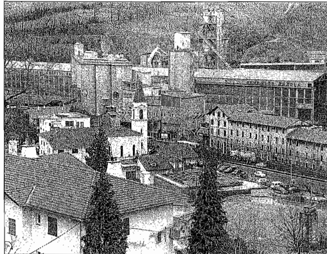
Rezola enpresako langileak greba egiten ari dira ostegun eta ostiraletan. Egunotan gutxieneko zerbitzuak betetzen ari dira.

horren aurka egin dute. Ez dute azpikontratatuak enpresarik nahi eta langile kopurua gutxitzeko arriskua dagoela diote. Bestalde, %7ko soldata igoera eskatu dute eta aurrerapenak gerora ordaintzeko aukera izatea. Luzerako diren bajei dagokienez, egoera bakoitza Enpresa Batzordeak aztertzeko eskatu dute. Horrez gain, osasun eta lan