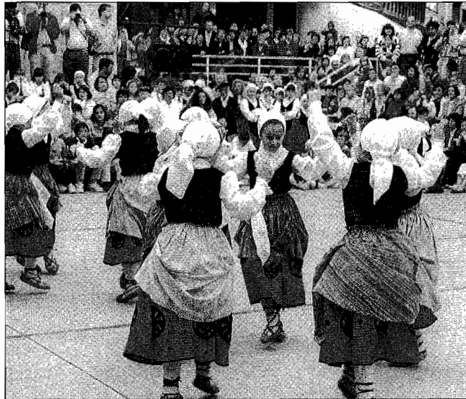
Aurten, beharbada, ez dira honelako irudiak errepikatuko auzoan. Izan ere, Martutene jairik gabe geratzeko arriskuan dago.

"Auzotarrek festez gehiago arduratzea nahi dugu, eta jai batzordea sortzea. Batez ere, gazteek parte har dezaten nahi dugu. Gu jada