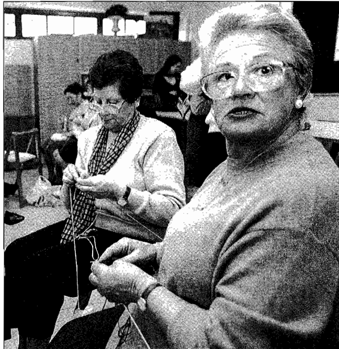
Jostun eta jantzizintzari buruzko ikastaroak egin dituzte Idiakez kaleko jubilatuen elkartearen

bukaera ezinhobea izan zuten gainera; Martin Berasategi jatetxean bazkaldu zuten eta.