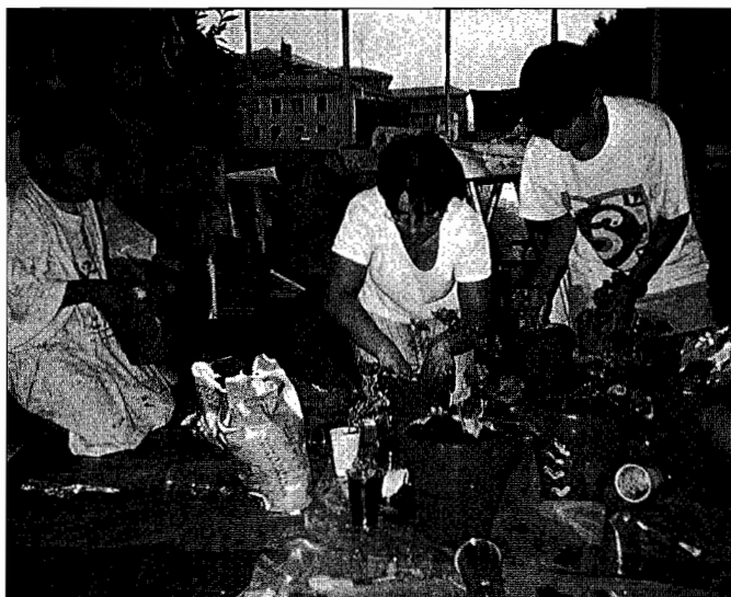
Haurrek lana gogotik egin dute Peru Ene Berri etxeko bidea apaintzeko. Bidea lorez josi dute.