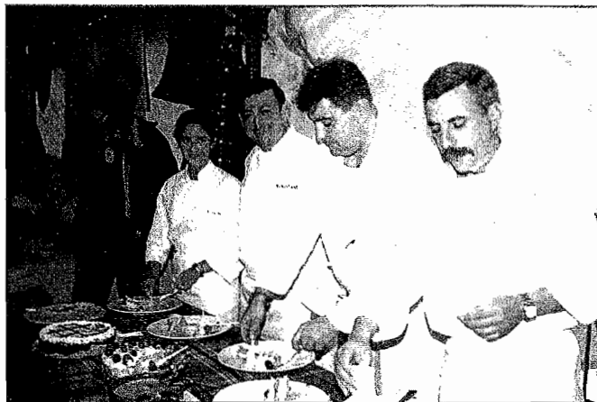
Aurten ere ia ez bezala hainbat sukaldari ospetsuk hartuko dute parte Intxaurrendoko Gastronomi Astearen.