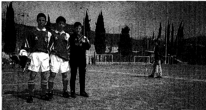
Sporting futbol taldekoak pozik daude egindako denboraldiaz.

Sporting taldeak bost jokalaria ditu Euskadiko selekzioaren beheko mailetan