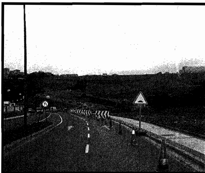
Hipermerkatuaren eta inguruko bidesarearen obrak izugarriak dira.

Bestalde, gogoratu ikastola berriaren inaugurazio ekitaldia igandean egingo dela aste osoan kultur ekitaldiak izan ondoren. Gaur ostirala rock kontzertua izango da Mugatik Out eta Tkak taldeekin. Bihar larunbata, haurren eguna izango da, goizez olinpiadak eta arratsaldez, Takolo, Pirrux eta Porrox pailazoak Gabriel Zelaia plazan. Igandean Artzak-Ortzeok elkartearekin batera egingo da jaia.