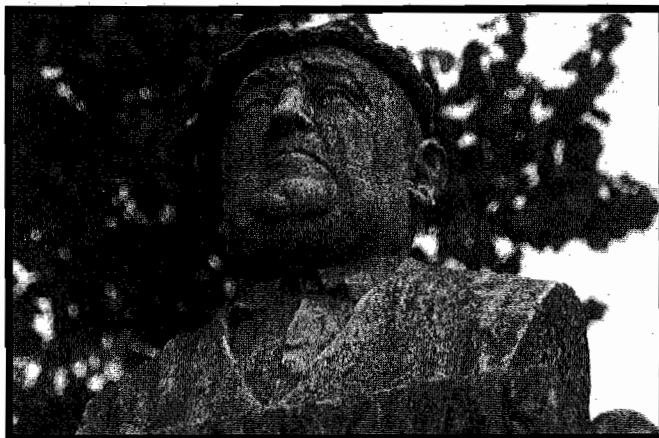
Txirritaren oroitarria Latxezar bere sortetxeko hondakinen gainean.

Hernanitik abiatuta, Uru- mea ibaian gora, Ereñotzu auzo xarmanta pasa ondoren Latxera heltzen gara. Hemen ibai nagusia utzi eta gure ezkerraldeetik datorren erre- karen ondoko bide estua hartu- tuta, 100 metro aurrera jarraituz, Latxe Zar baserri- ren hondakinak aurkituko ditugu bide ondoan. Hauen erdian, harrizko zutabe baten gainean, berriz, Jose Manuel Lujanbio «Txirrita»ren iru- dia. Bai, historian zehar izan dugun bertsolari handiaren sortetxea izan zen Latxe Zar baserri hura. Gure «Txir- rrita» handiaren oroigarria pasa eta arestian, Ursoko deituriko mendian sartzen gara. Gaur egun gehien bat izen honekin Agiñamendiko iparraldeko hegari deitzen zaio, baina XIX. mendera arte Donostiarenak izan ziren mendi hauek, lehen lurralde gehiago hartzen zituzten. Latxetik hasi (mendebaldean) eta Izenede- rraino (ekialdean) zabaltzen ziren. Iparraldetik Akola eta