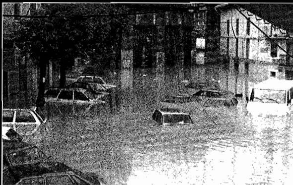
1992ko ekainean San Luis plazan izandako uholdeak.