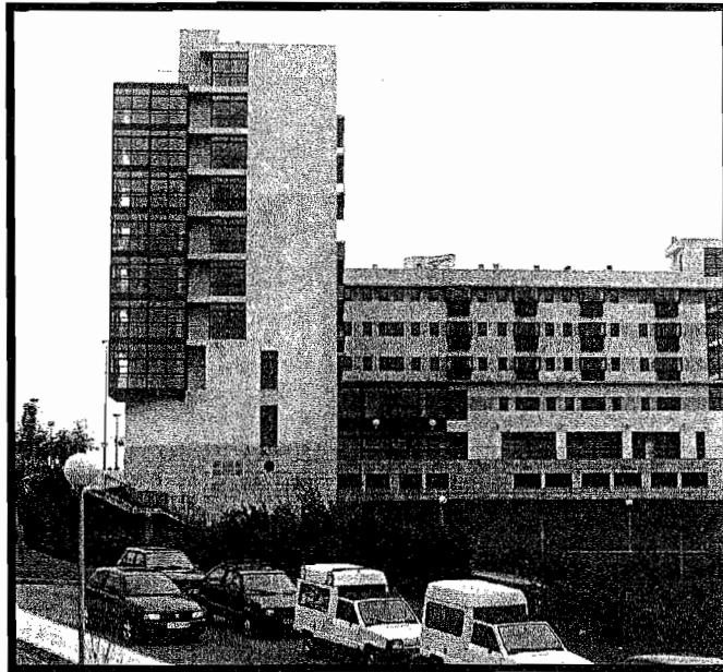
Txara 1 eraikin erraldoi eta modernoa da, zahar eta elbarrituentzat erabat egokitua.

Bianditzera ibilaldia antolatu du larunbaterako, hilaren 23rako. Goizeko 08.00etan irtengo dira Zubiaurre zubitik eta lineako autobusa hartuko dute. Norberak bere bazkaria eraman behar du eta autobusa ere norberaren kontura izango da. Gazte asanbladak gazte guztiak ibilaldi honetan parte hartzerantz animatzen ditu. Bestalde, gogoratu behar da baita ere, talde honek afari bat zozketatzen duela abenduan egingo den zozketan. Txartelak ohiko lekuetan izango dira salgai.