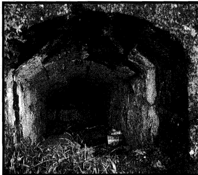
Lazuneko karobiak sastraka artean ia ezkatatuak.