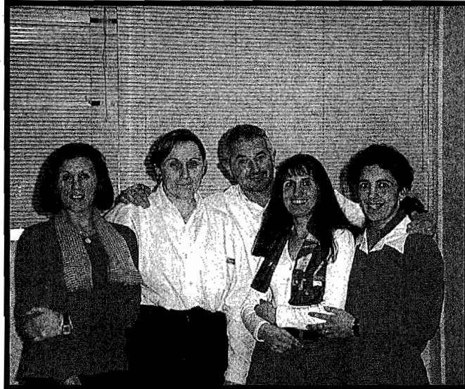
Gaueko 22.30etan oraindik ere entsaiatzen ari ziren Ausartak taldekoak, pasa den asteartean.

Guztira sei dira aurreko urteetan egindako lanak: «La mujer sola», «La triple s», «El lavadero», «Casa pura» eta «Las amargas lágrimas de Petra Von Kant». Aurten berriz bi lan ezberdin taularatzeko asmoa dugu. Alde batetik, jadanik estreinatutako «Menos que nada» baka-