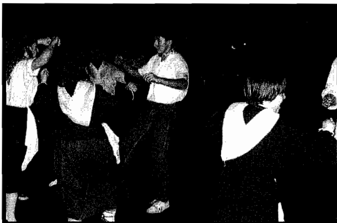
Donostiako Jai Batzarreko komisioa jaiak KTEren ardurapean geratu zirenean sortu zen, guztiek ordezkari eta solaskide bera izan zezaten.

Izen emateak Serapio Mujika kaleko 10.can egindo dira, hau da, Moneda Baserrian edo bestela 39 54 99 telefonora dei dezakezue.