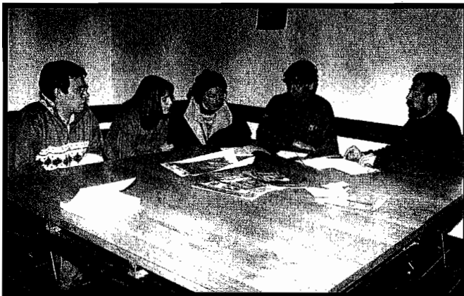
Ostegunetan biltzen dira Herri Berriko egoitzan, arratsaldeko zazpiretan.