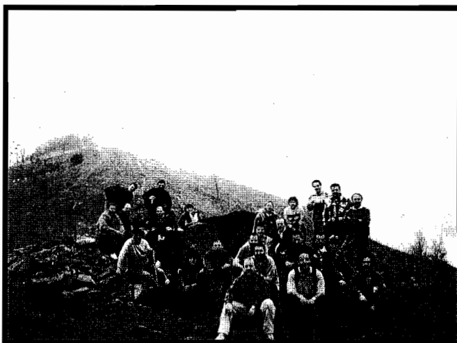
Epeleko eta Astigarraga arteko zeharkaldiari dagokio argazkia. Bertan, Sagastietako trikuharrian pausatuta ditugu txangolariak, txakur eta guzti.

bigarren etaparako 15 kilometroko ibilbidea prestatu dute Santiagomendikoek, gehien bat Jaizkibel mendian barrena igaroko dena. Noizko? Ba ekainaren 4rako, igandea. Gipuzkoako Birarekin segituz, etapa honetan Pasai Donibaneko Larrabide baserriatik gorantza abiatuko dira. Behin Jaizkibelgo errepidera iritsita, mendi zidorra jarraitu eta inguruko dorreen artean pasatuz tontorrera (455 m) helduko dira. Ondoren, maldan behera Guadalupeko Amaren Santutegira; han atse-