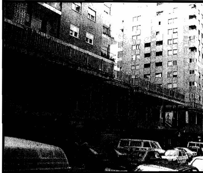
Larratxoko dorreak jai giroaz bilduko dira hurrengo asteburuan.