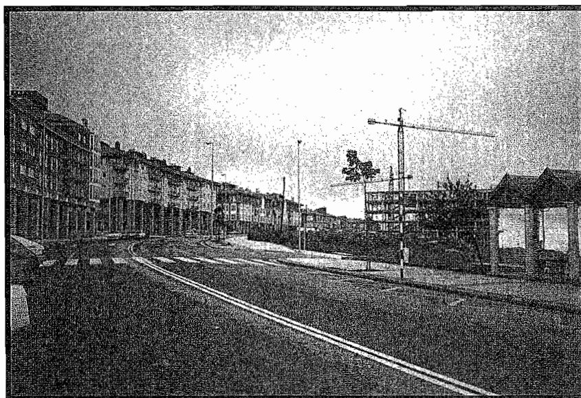
Urte gutxitan Intxaurrondo Donostiako auzorik handienetakoa bihurtu da.

Bi fasetan egingo dira lanak. Lehenean, hasita dagoena, 120 etxebizitza eraikiko dira. Egitura