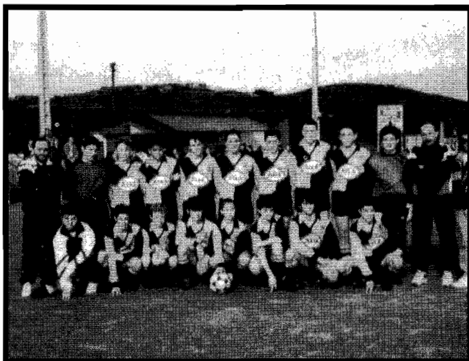
Sporting Kirol Elkarteko kirolariek emaitza onak lortu dituzte denboraldian honetan zehar.

Denboraldian izan dituzten emaitzen artean