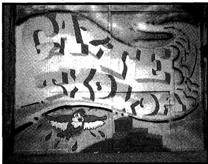
Konponketa, margotzea eta antolaketa guztien artean egin dute eta horren adibide gisa, sarreran landu duten mural izugarri hau daukate.