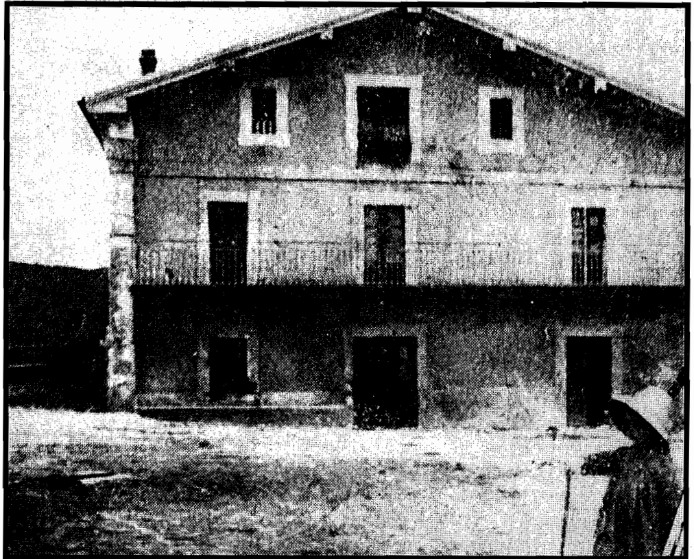
Alkatetza ere urtetan izan du Altzak. Hona hemen eraikuntza zaharra. (Altzako Historia Mintegiko Fototekaren

Donostiarekiko loturak, zabalkunde urbanistikoak eta hazkunde demografikoak erabat aldatu dute bere itxura eta nortasuna. Historia berreskuratu eta jendeari gogora arazteko ahalegin bat eginez, duela urte batzuk Altzako Historia Mintegia sortu zen. Altzatar talde honek donostiar guztiei eta bereziki altzatarrei bere iragana ezagutarazi nahi die.