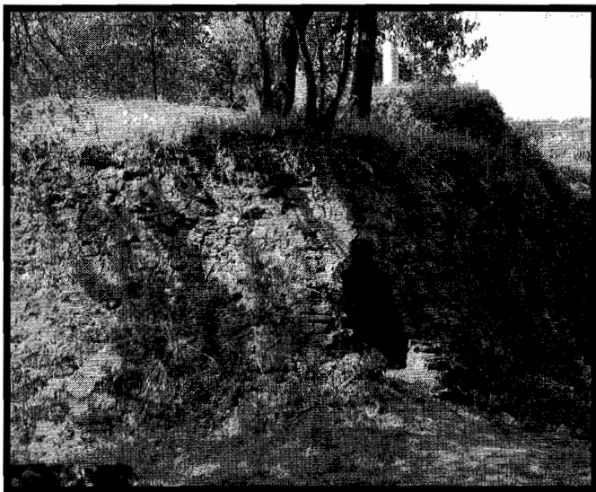
Ametzagainako gotorlekua sasiz eta zikinkeriaz garbitu dute eta San Markoseko gotorlekua ere eraberritua dago.