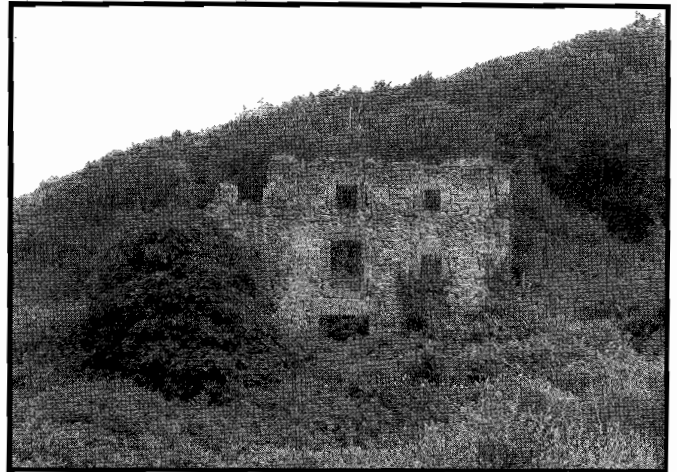
«Barraka baserriko horma zaharra»