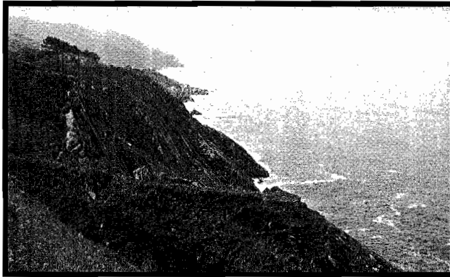
Lurmanda, Igeldo herriko kostaldean.

T ximistarri parajea oso ezaguna da baina nork ezagutzen ditu bere ondoan dagoen Lurmandako harlasta deituriko amildegi beldurgarriak? Agian oso donostiar gutxik. Lurmanda , Lurmenda , Lurmanta , Gurmenda , Durmanda edo Plateta izenekin ezaguturiko harlasta, Igeldo herriko Amezti auzunetik hurbil, Tximistarri eta Urilletako harkaitzetatik mendebaldera dago. Duela urte batzuk agian asko- adiskideak lanpernetara joaten ginen Lurmandara . Igande goizetan Antiguatik oinez irten, Arbizketa eta Marbill base- rrien ondotik, Muitzara igo, eta Aiztoki iturriaren albotik jarraituz, oso maiz joaten ginen itsasoa bare zenean eta marea behe- retan. Arroka erraldoi haietatik zintzilik, olatu batek irentsiko ote gintuen beldur, urduritasuna, harkaitzari lapa bat bezala helduta menperatzen genuen. Batzuetan, gure arrantza osatzen genuenean Igeldo herriko ostatu batera joaten ginen. Han lanpernak egosten zizkiguten eta lagun artean jan ondoren, berriz ere Antigua aldera abiatzen ginen joan ginen bezalaxe: oinez. Beste batzuetan ere joaten ginen itsas bazter eder hauetara: batez ere, ekaitza edo enbata zenean. Lurmandako begiralekuan jarritz gero, arroka hauek ekaitzak astintzen dituen- an, benetako zirrara senti- tzen da barnean.