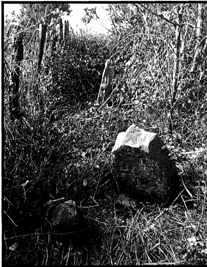
Mojabasoko mugarriek gaur Barrenetxe, Asurriki eta Baldaberri baserrietako jabeak mugatzen dituzte.

Mojabaso (Monja-Basoa dokumentuetan) Igeldon dago, komunitate politiko honen hegoaldean, Donostiako udalbarrutiaren mugetan. Balda-errika edo Urteta-errika deitzen denak banatzen du Usurbilgo udalbarrutitik. Garai batean Mojabaso hariztia zen baina gaur hainbeste sute pasa ondoren (hiru azken urteetan) dena otadi eta sasia bihurtu da. Batzutan ingurunea sasi bihurtzea ez da txarra zeren eta joan den urtean, aspaldiko urtetan gertatzen ez zen bezala, basurdeak azaldu ziren paraje hauetan, babesleku onak baitituzte Mojabasoan . 1995. urteko udazkenean Usurbil eta Aginagako ehiztari talde batek basurde bat hil zuen Mojabasotik hurbil Gaztanalegiko errekan , Garoa kanpinaren azpikaldean. Mojabaso oso lur-eremu berezia da. Aspaldidanik Igeldoko finka lur-eremuz handiena den Barrenetxe oinetxea dagokio eta Barrenetxerekin batera Valdellanoko markesaren jabea da. Bitxia baldin bada ere, joan den mendean administrazio militarrek egindako mapa batzuetan Mojabaso Usurbili atxekitzen diote. Usurbil aldetik Errikoetxe baserria dago, beraz, toponimoak garbi adierazten duenez, «herriarena» izan zen etxea; Errikoetxerekin batera Usurbilgo komunalak -herrilurrak- izan ote ziren Mojabaso eta Errikoetxe ? Agian. Murgil , Asu-