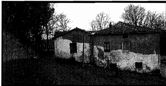
Lugaritz etxea mendebaldetik ikusita.