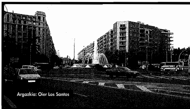
Pio XII.ren Plaza eta Astoria zinema. Hemen zegoen «Kolkene».

estutzea agindu zuela jaun honek, auzotarrekin izugarriko iskanbilak sortuz.