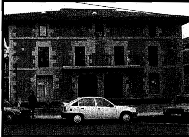
Kasares oinetxeako aurrealdea.