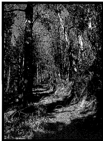
Igaratik Igeldorako bide zaharra Ekogortik gora.