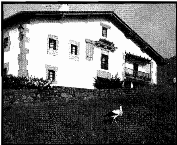
Zikoina bat Ekogor baserriko atarietan 1995. urtean.

martxan. Ekogor Aundi baserria oso eraikin ederra da, paregabeko harlandutako leiho, ate eta ertzak ditu. Aurrealdean, berriz, hama-hiru itsu baten profila. Ekogor ren aipamen zaharre-