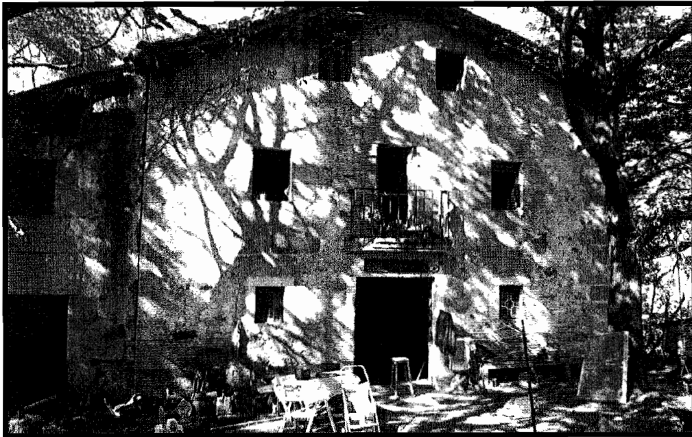
Egiluze baserria. Donostiako Udaletxetik urrutien dagoena.

Donostiako Udalbarrutiko lurretan, Egiluze (Euluxe) da mandabaldeagora dagoen baserria. Donostiar baserritarren artean, Igeldoko herriari dagokion etxe hau, beti kontsideratu da ia munduaren bukaeran zegoela, oso urruti, itsasoko harkaitzetan ia aurkitu ez dezakegun paraje batean. 1863. urtean egin zen Gipuzkoako etxe zerrendan agertzen da Egiluze baserria Udaletxetik 10,4 kilometro-ra! dagoela. Datu hauek garbi adierazten dutenez aipatu zerrenda honetan Donostiako ia 700 baserrietatik urrutien dagoena. Horrexegatik urruntasunak ematen dio bere ospea eta misterioa Egiluzeri. Kontatzen da etxe honetan bizitzera sartzen ziren baserritarrak joan egiten zirela ahal zuteanean eta honela ez omen da inoiz hil inor bertan. Jende gaztea eta neka ezina bizitzeko egina zela dirudi! Hain