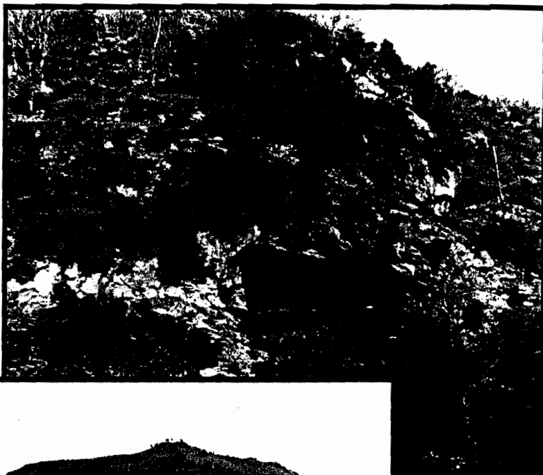
«Landarbasoko kobak Larratz baserriko bidetik ikusita»

Donostia inguruko base-ri batean jaso dut istorio harrigarri hau: behin batean alhantz batek ihes egin omen zuen Larratz baserritik. Koban sartzen ikusi omen zuten eta handik hiru egunera Aranou azaldu omen zen; horregatik bada Landarbasoko kobak «Nafarroan ateratzen direla» sinesten duenik. Horrelako istorio harrigarri hauetaz aparte, egia zera da: Landarbaso izango dugu ziuraski, gu, donostiarron historiaurreko leku nagusia, bai kobak eta bai inguruko zortzi (!) trikuharrak frogatzen baitute antzin-antzinatik gure arbaso zaharrenak Landarbaso bizi izan zirela.