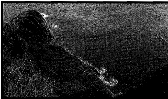
Monpaseko muturraren eskuinera, Txiñardi eta Kunbako Zulu daude.

natutako hare-harrizko «txo-txazko», donostiar petoen hiztegiaren harkaitzak zuloaz