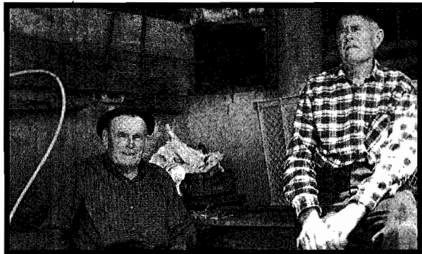
Etxarri anaiak, Goikoeneko nagusiak.