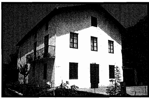
Goikoene baserria Loiolako Goiko Erriberetan.

Nire iritziz, berriz, oso egokia dela diot zeren Loiolako Erriberak bi zatitan banatzen ziren: Beko erribe- rak -gaurko Amara Berri eta Loiolako kaskoaren artean zeudenak- eta Goiko Erribe- rak - Patxillardeg i baserria eta Martuteneko kartzela (Loiolakoa behar zuen izan baina) artean direnak-. Azken hauetan dago Goiko- ene . Aipatu ditugun bara-