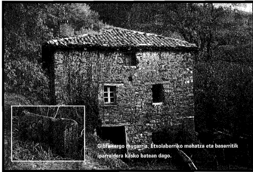
Gihaitargo mugarrja. Etxolaberriko mehatza eta baserritik iparraldera kasko batean dago.

Urumea haranean mendian nabilela, Ereñotzuko aiton batek hau esan zidan: «Aranoko mugetan dagoen Etxolaberri mehatza eta baserria, Eztiza eta Asketa mendiak Donostiarenak ziren». Harritu egin nintzen ikusita nola oraindik zahar batzuek oroitzen duten, joan den mende erdi aldera arte Donostiako hiriarenak ziren Urumeako Zillegietako hego aldean dauden mendi zabalak. Zilegi mendi edo herri mendi zabal hauek XIX. mende aldera desamortizazio legeak zirela eta Donostiako hiriak galdu egin zituen. Jabego pribatuetara pasa ziren eta garai berean ere Hernaniko jurisdikziora. Eremu zabal hauek iparraldetik Hernaniko dermioarekin mugatzen zuten; hego aldera berriz Berastegi eta Elduaiengo lurrekin. Mende baldera Urnieta zuten eta ekialdera berriz Arano herri nafarra. Oso aberatsak ziren, ohian, baso, artzantza eta mehatzak zeuden bertan. Etxolaberriko mehatzak oso handiak ziren, pirita edo betaberun zilartsua ateratzen zen, entrepresa ingeles batek ustiatua, hainbat lan-