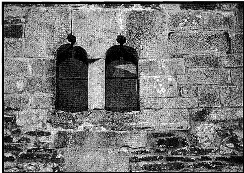
Leiho bikoitz edo «nagusileyoen» xehetasunak.