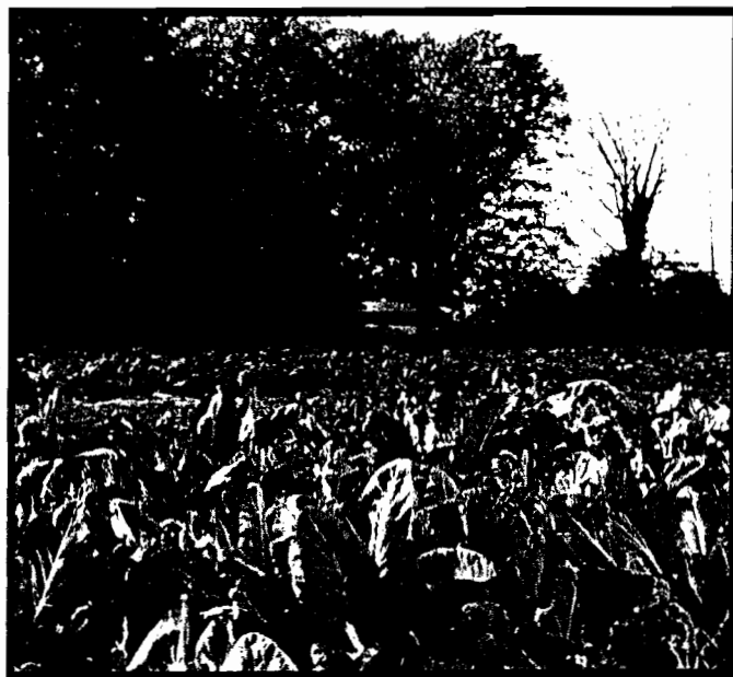
Baserria suntsitu zuten, baina oraindik hor daude Martikotxotegiko baratza ederrak.