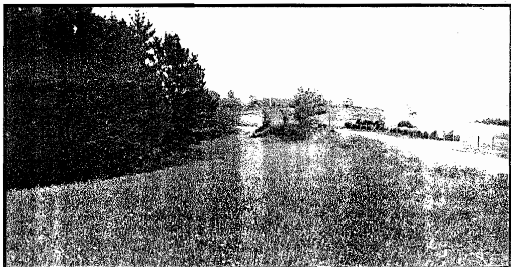
Xoldaularria, 1876. urteko gatazkan hildakoen hilerria. Laister eraikitzeko den autobide berri batek gaurko baserriaren d...