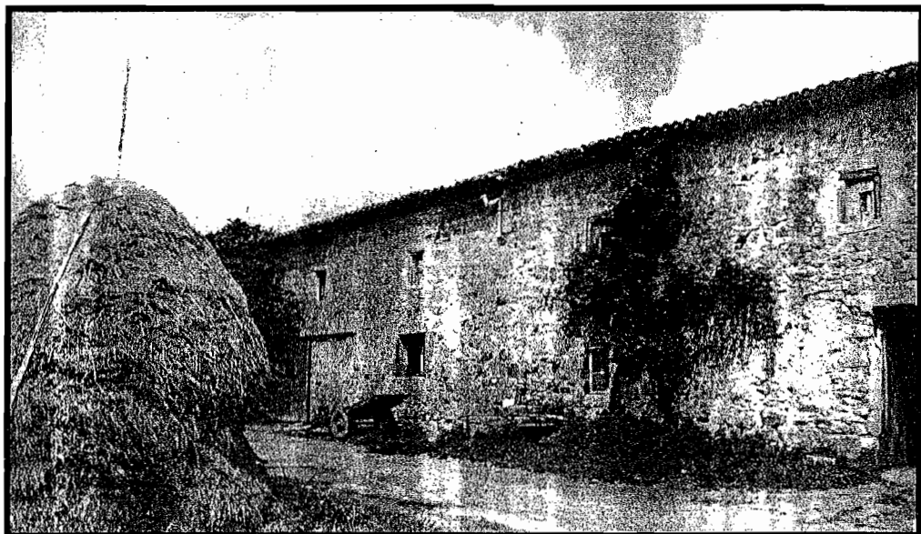
Barkaitzegi baserriaren ikullu-aurreak.

Donostiako erdigunetik urruti. Lugaritz auzoan dago Barkaitzegi baserria. 1862ko erregistroan aipatu auzoko 90. zenbakia zera-man baserri-etxe honek. Garai bereko Gipuzkoako etxe zerrendetan, berri-z. beste datu interesgarri batzuk irakur daitezke: hiriko udallexetik 6.5 kilometroa dago etxe hau eta hiru solairuko eraikuntza zen, non bi familia bizi ziren. Usurbilgo udalbarrutiko mugatik hurbil, gain zabal batean eta Donostia hiritik Zubieta herrira zihuan bide zaharraren ondoan zegoen. Hirugarren karlista gudua gertatu zuenean Lugaritz eta Ibaetako lurretan gatazka handiak izan ziren. Honela, 1876. urteko urtarrilean Berio gaineko Artolako gotorlekua harrapatu zuten liberalak «beltzek», eta bertatik karlistenak ziren Benta Zikin etik hasi eta Barkaitzegi ra arteko gotorlekuak bombardatu zituzten harrapatu aurretik. Honela suntsitu zuten Barkaitzegi . Gatazka odoltsu haietan hildako gudariak Xoldaularria zelaian daudela entzun izan diet auzoko zaharrei. Ondorengo urteetan gaur ikusten dugun Barkaitzegi baserri berria eraiki zen, baserri zaharraren kokapenetik 200 metro hegoaldera eta haren harriekin.