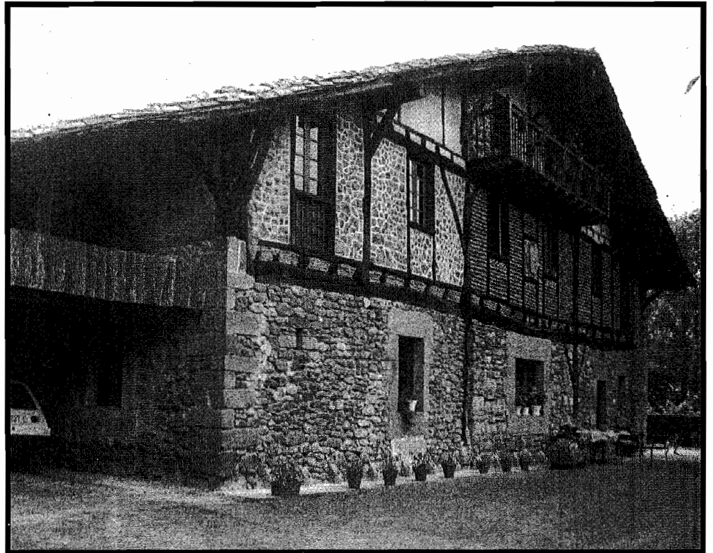
Aliri, Zubieta herriko oinetxea.

Gure hirian baditugu sendi donostiar peto-petoak; beste askoren artean, altzatarak diren Kasares edo Arzak izenak datozkit lehenik burura. Baina sendi donostiar izan eta gainera bere sortetxe edo oinetxean bizitzea oso kasu gutxietan gertatzen da. Hauen artean Aizpurua eta Aliri ditugu Zubieta auzoan. Aizpurua oso historia luzeko etxea izan arren, ez dio Aliririk inbidiarik, bere parekoa baita. Gaur begi bistan dugun Aliri , Aleri edo Alli deitzen dugun etxe ederra XVI. mendean egina izan zen eta garai haie-tatik gaur egunera arte beti etxearen nagusi izan den Aleri sendiak zabaldu eta handitu izan du. Beraz, etxe honek aliritarren 20 belaunaldi ezagutu ditu bere teila-tupean. Aliri oinetxea XVI. mendean kokatzearekin ez dut esan nahi sendi hori orduan sortua denik; zihur