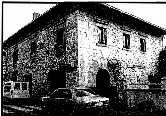
Intxaurreondo Haundi oinetxea. Iparsartaldeko ate eta leihoak.

Donostian agian Altza izango dugu oinetxe gehien eta boteretsuenetakoa zituen herria: Arzak, Arriaga, Kasares, Kasanao, Arnaobidao edo Ernabiro, Txipres, Merkader, Larrerdi, Berra, Garro, Boneo edo Mone-da, Larratxao edo Larratxo, Garbera, Parada, Algarbe, Intxaurreondo... eta hainbat gehiago. Gehienak zoritxarrez desagertu dira baina beste asko hor dago zutik gaur ere eta horien artean zer esanik ez Intxaurreondo Haundi (eta ez Intxaurreondo Zahar horietan idatzitako kartelak dion bezala) izango dugula ederrenetakoa. Eraikuntza eder hau XVI.-XVII. mende aldaketan egina da. Beraz, 400 urte bete ditu harearriko har-