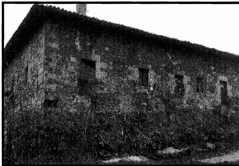
Ubegi baserriaren hegoaldeko aurrealdea.

Altzako herriaren parte izan zen Ubei edo Ubegi baserri ederra. Ametzagaña mendixkaren hegoaldeko egian kokatzen da, eguteraan, nekazaritzarako ezin hobeak diren lurrez inguratuta. Horrelako paraje erosoak gure lurreko historian antzinatik, beti, eskatuak izan dira eta arrazoi horrexegatik etxe zahar eta onak leku horietan aurkitzen dira. Hauetako bat da Ubegi , XVI. mendeko etxe aparta, karratua eta lau uretako teilatu batez estalia. Jauregi baten itxura eta edertasuna ditu. Gaur bi bizitzetan zatitua dagoen baserri honen zurezko egiturak mirariz gaurdaino iraun du; hainbat gerra, ekaitz eta sutetik salbatu egin da. Bere barnealdeak