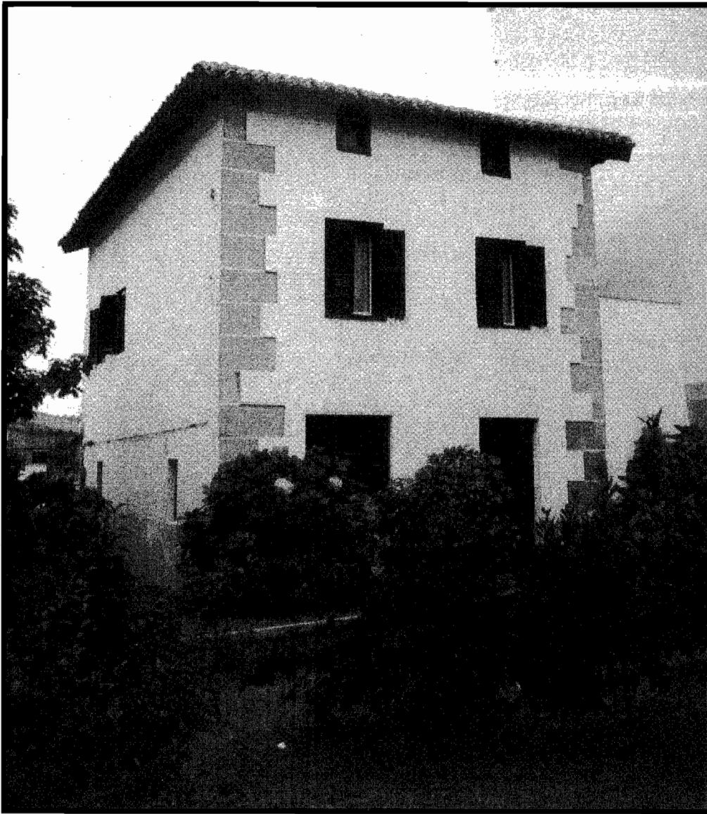
Barbotegi etxea. Altzako San Marzial elizaren ondoan.

Altzako plazan San Marzial elizaren iparraldeko hormaren ondoan etxe txiki zahar bat dago. Etxea oso ongi zainduta dago: txuriz margotua, hareharritziko harlanduak ertzetan eta lau ureko teilatua. Esan dezakegu zalantzarik gabe, gaur Altzako plazan dagoen etxerik txikiena dela baina baita politena ere. Etxe hau ez da inoiz izan baserri edo kale-etxe arrunt bat, beti Altzako