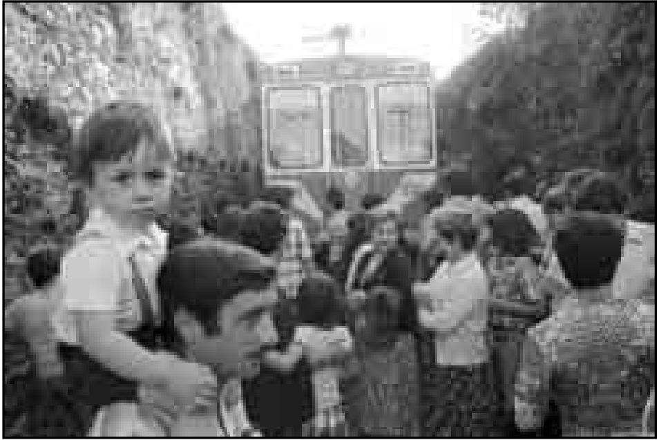
Movilización de los vecinos de Oleta a favor de cubrir las vías del Topo a su paso por el barrio. Año 1975