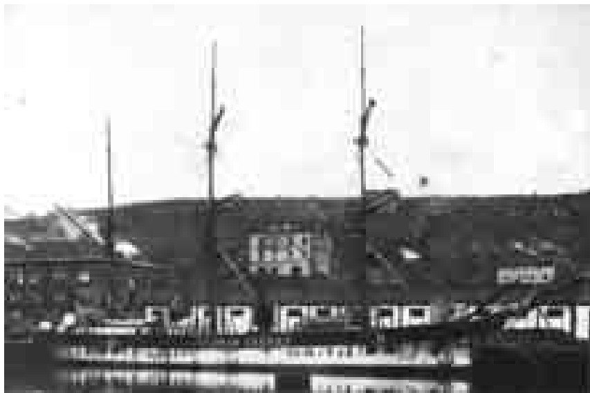
Velero amarrado en la dársena de Herrera. Detrás, de izquierda a derecha: la casa grande del puerto conocida como Cuartavía, Kosta-Etxeberri, Kosta-Etxeberri Gain, y la Villa Oleta. Año 1876

Podríamos decir que Oleta es de los pocos barrios de Altza que ha podido llegar a nuestros días sin haber cambiado su esencia, no al menos de una manera tan radical como ha ocurrido en la mayoría de las zonas urbanas del antiguo territorio histórico de Altza.