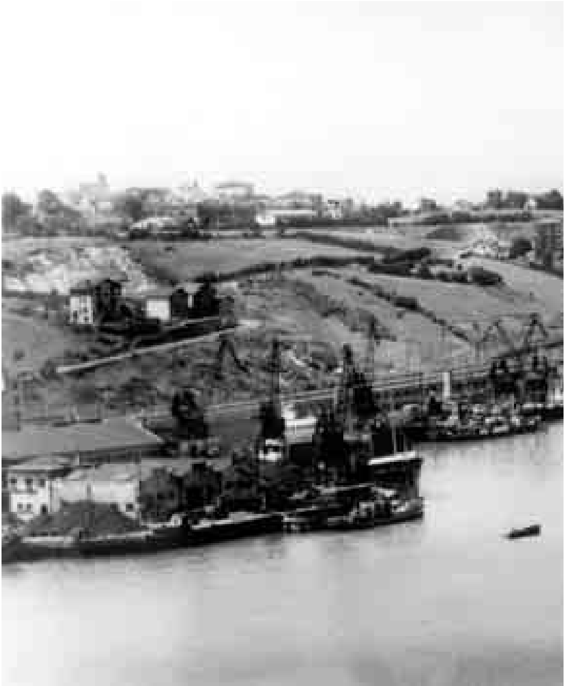
Vista panorámica del puerto de Pasaia, Alzagaina, Buenavista y Oleta. Años 50