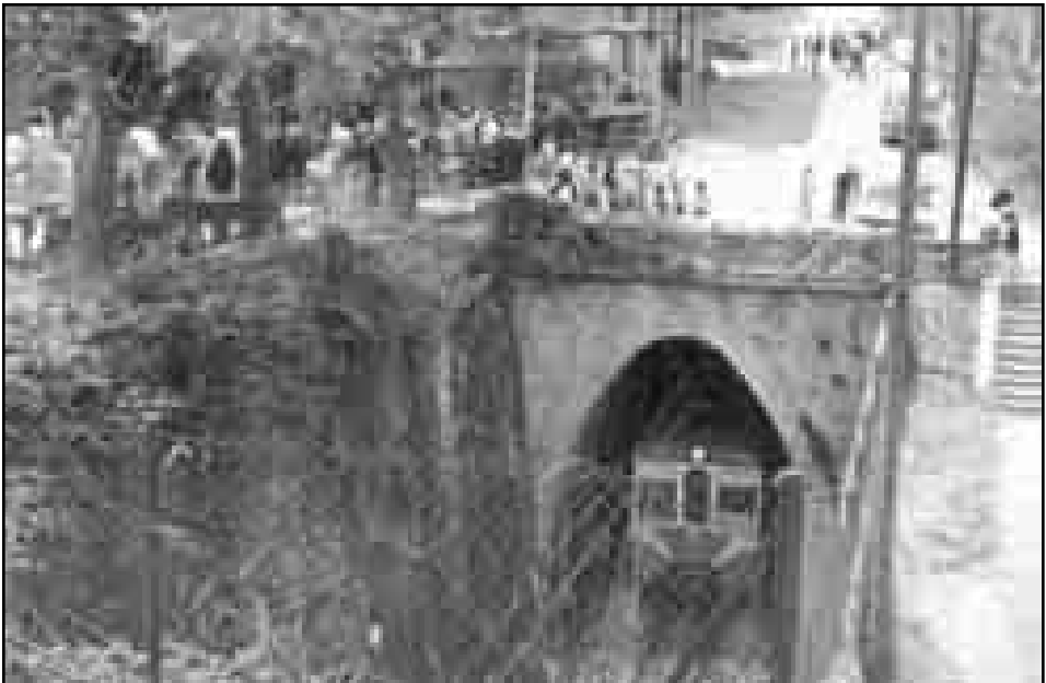
Fiestas de Oleta. Año 1976