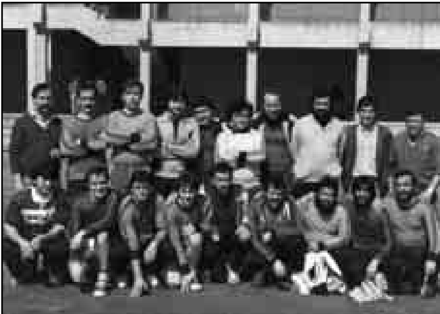
Equipos de Boskotarrak y Oleta, en el Campeonato de Fútbol-Sala. Año 1983