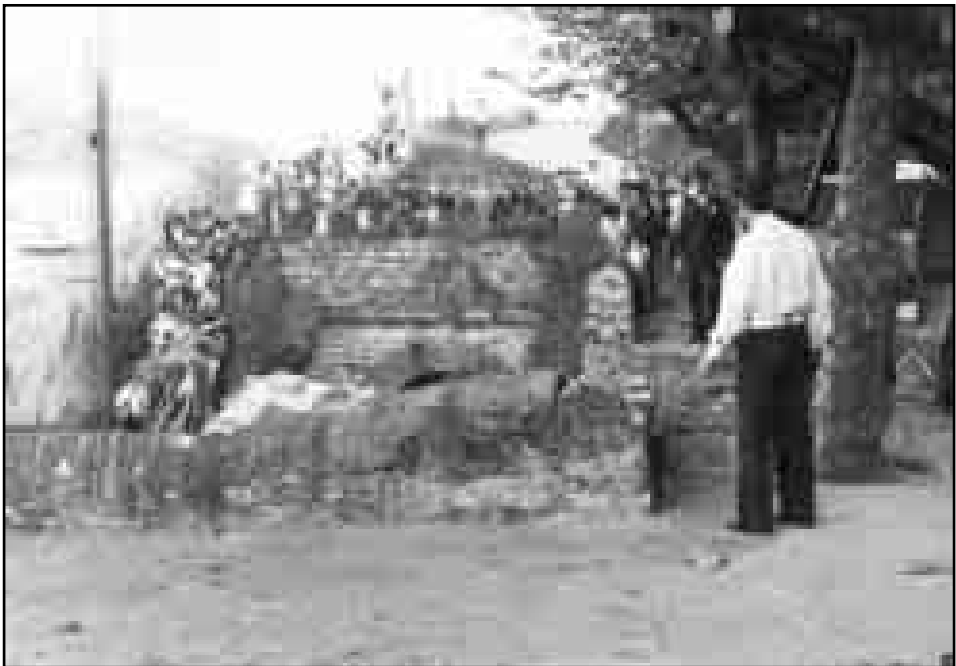
Camión caído a las vías del Topo. Año 1976