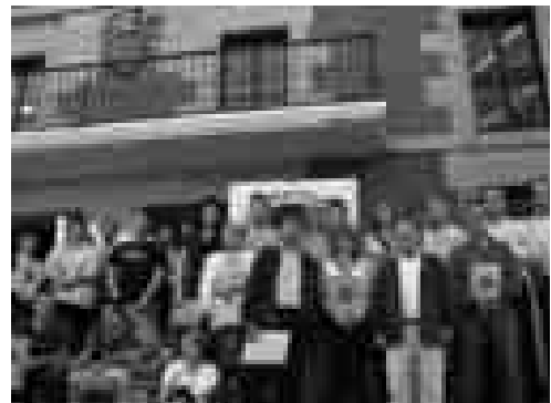
Ziurtagirien banaketa ekitaldia 2005eko ekainak 8