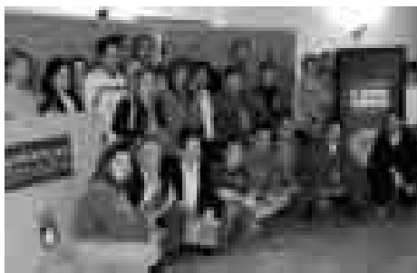
2007-5-15 / 8. irudia

Sinatzaile kopurua aurreikusitakoa izan zen, beraz, balorazio ona egiten dugu. Hala ere, lan hau bi fasetan egin zenez, bigarren aldiko eragileek ezagutza handiagoa zuten, eta alor horietako eragileak erraz erakarriko genituela uste genuen, baina ez zen hala izan. Ahalegin handia egin behar izan zen eta epeak luzatu ziren. Honen zergatia fase biotako arloen arteko ezberdintasunean kokatu dugu: bigarren fasekoak helduen bizimoduari zuzenean lotuak, eta lehenengoak gazteekin zerikusia dutenak; gazteekin lan egiten dutenak erakartzeko errazagoak izan ziren, euskara “gertuago” dute. Hain zuzen ere, Altzan euskarak arazo nagusia non duen konstatatu zen.