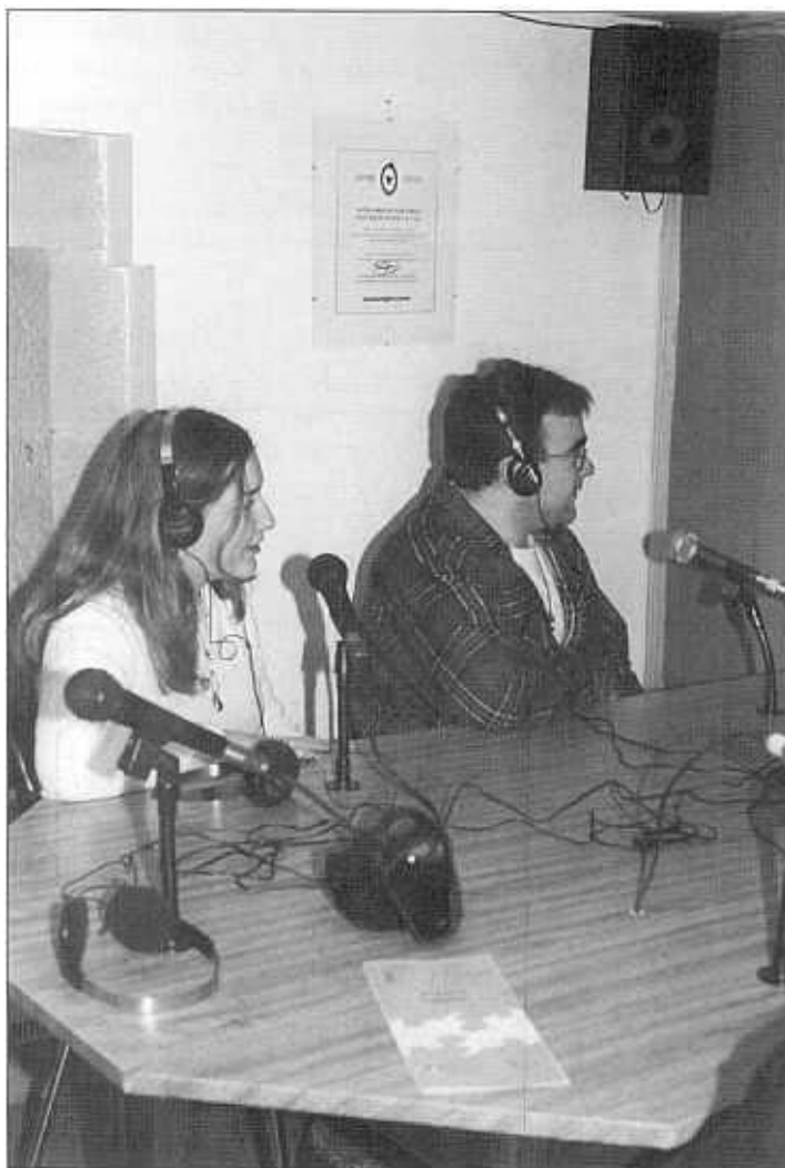
Algunos de los participantes en el Taller de Radio.