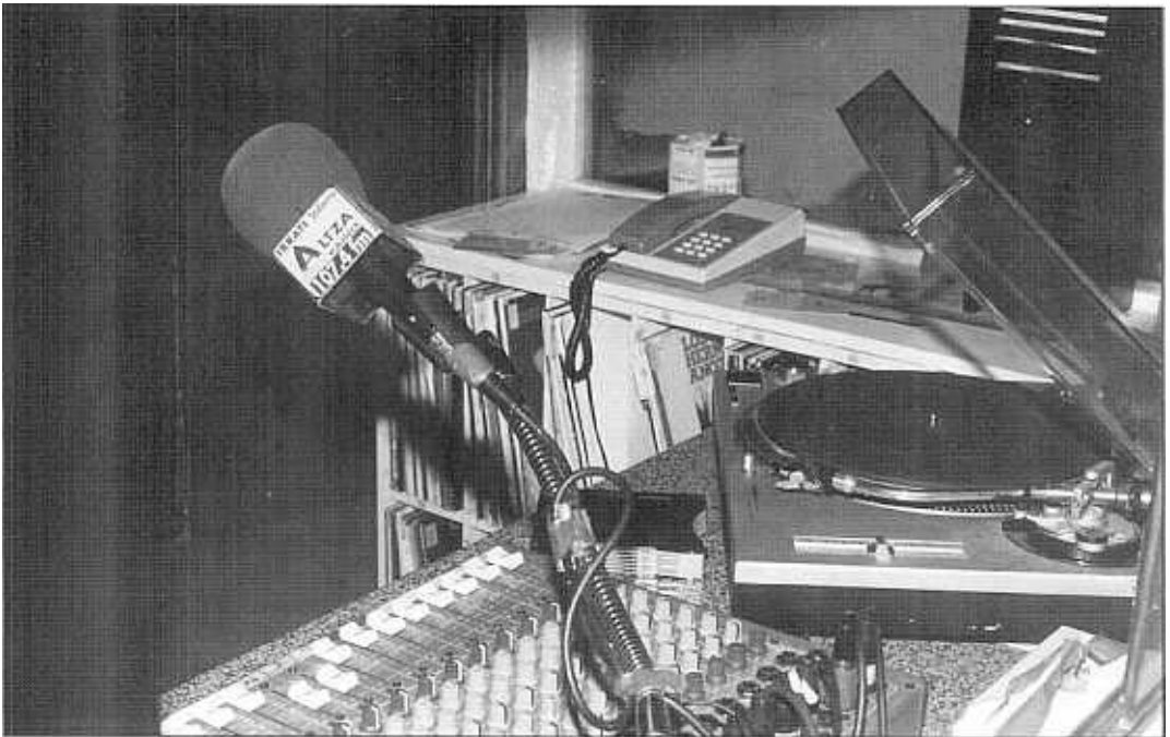
Altza irrati Tailerrak eskuratu ditu aurrerapen teknologikoak eta horrek lana erraztu digu.

Are gutxiago gurea medio txikia izanik, eta txikia esaten dugunean zerotik hasi garela esaten dugu, poliki-poliki eta banaka-banaka entzuleak lortzen goaz eta beste medioen errespetua eta onspena eskuratzen hasi gara. Baina horretarako bost urtez egunero lanean aritu gara eta gure erronkak gainditu ditugu, nahiz eta oraindik erronka haundiagoak izan. Halaber, teknika hobekuntza garrantzitsua behar dugu eta leku haunditze bat ere ez datorkigu batere gaizki. Abiapuntua kultur etxea da eta hasieratik bertan kokatu ez bagara ere hiru urtetik ona han izan gara eta sinisten ez baduzue etorri gu ikustera.