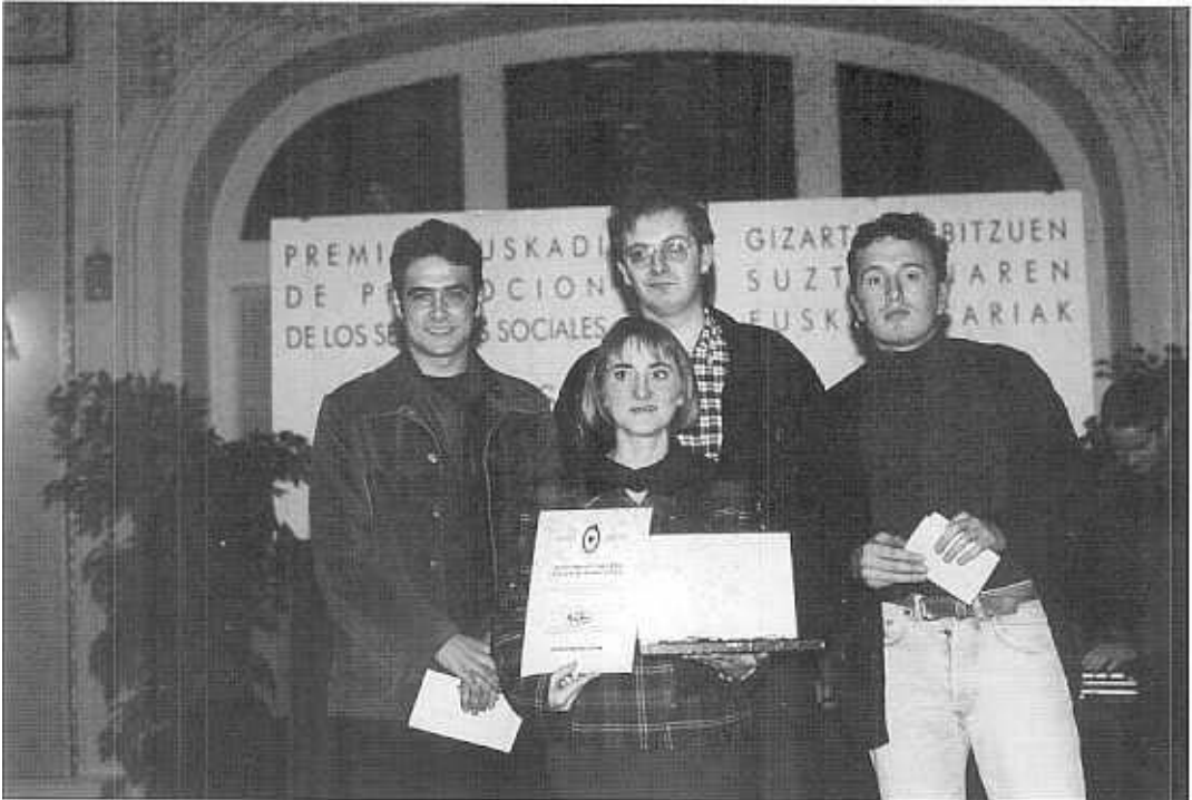
Sustatu saria eta irabazleak.

Luego vinieron los reconocimientos y el saber hacer con programas como "Sobre el Mantel" Mención Honorífica en los Premios SUSTATU'94 especialidad Radio o Primer Premio en la misma especialidad en el año 95. Destacar además de ello los experimentos llevados a cabo por parte de nuestros alumnos como es el caso del programa "escrito en el aire" con el que pusimos en entredicho el hecho de los "mensajes subliminales" y vivimos en nuestras carnes "la manipulación del mensaje radiofónico". Son pequeños ejemplos de lo que el tiempo ha permitido hacer en un lugar como éste, un taller de radio que como su propio nombre indica permite desde el respeto poner en práctica todas estas expectativas de sus participantes.