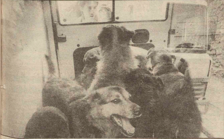
Los perros fueron introducidos en furgonetas y trasladados a unos terrenos de Aya.