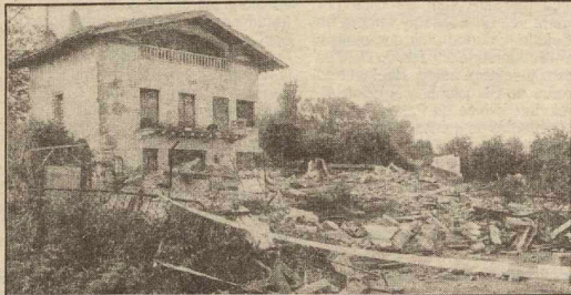
Las casetas fueron destruidas y villa Lolita precintada.

Los laceros y veterinarios del servicio municipal se presentaron en villa Lolita sobre las ocho de la mañana. Los cerca de 150 perros que estaban en sus instalaciones